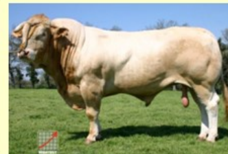
Apolon (V. van Darling) DM53 DS66 QR41 AF49 NG84