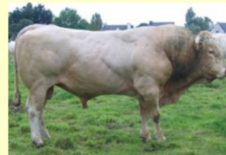
Tilbury (V. van Dizier du Moulin) DM77 DS81 QR84 AF77 NG80