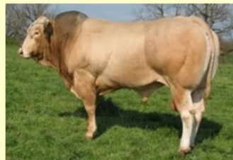
Voltaire (V. van Manitou vd WH) DM80 DS81 QR88 AF83 NG83

Exterieur Lft SH O Rt Bs B AV 2.4 149 88 87 85 87 87