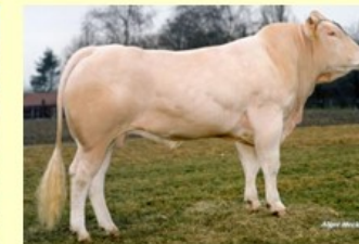
Joconde (V.V.van Bionda) 1.11 sh.149 O87 RT88 BS88 B87 AV88