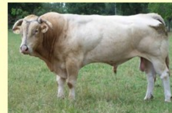
Comidien (V. van Impatiente) DM80 DS83 QR90 AF73 NG81