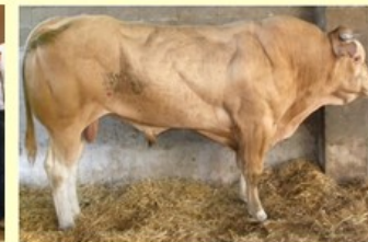
Evian (V. van Jolie) DM73 DS91 QR90 AF78 NG83