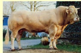
Cancan (V. van Furet du Moulin)) DM 7 DS9 QR8 AF8 NG80