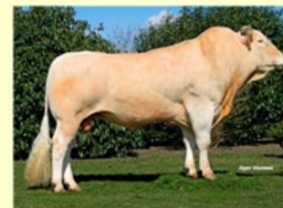
Tabalounga (V. van Bernice) 4.6 sh. 161 O88 RT88 BS90 B87 AV88