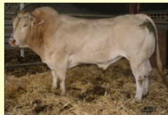
Scout (V. van Gambela) DM76 DS77 QR94 AF77 NG80