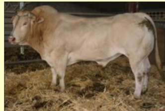
Scout (V. van Calypso) DM76 DS77 QR94 AF77 NG80