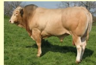
Voltaire (V. van Gaillard) DM80 DS81 QR88 AF83 NG83