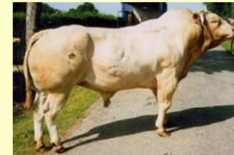
Leprince (V.van Valex) DM53 DS60 QR40 AF42 NG78