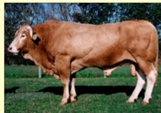
Orion (V. van Pion Melody) DM80 DS81 QR90 AF82 NG83