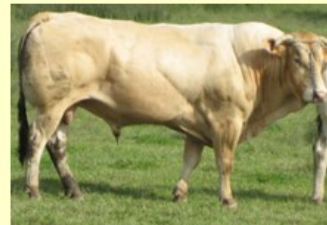
Ublond (V. van Cauet Roz) DM51 DS56 QR42 AF46 NG78