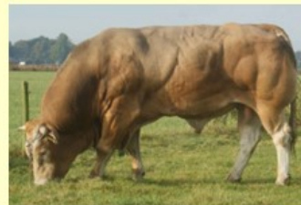
Zandv.Grandeur (Volle broer van Zandv.Julian) 5.6 164 O90 RT89 BS92 B88 AV90