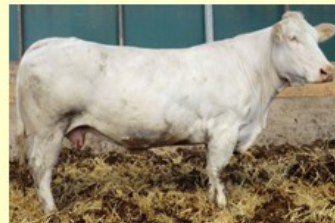
Bionda ( M.van Illusion) pref.stamm. 8.0 sh.150 O86 RT86 BS86 B84 AV86