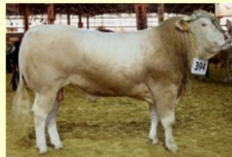
Brooklyn (V. van Gala) DM77 DS93 QR84 AF77 NG83