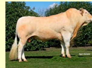
Tabalounga (V. van Bakersf. Erika) 4.6 sh.161 O88 RT88 BS90 B87 AV88