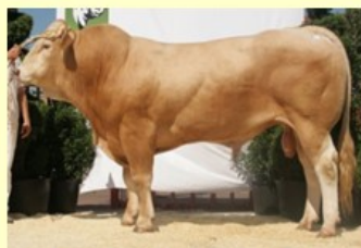
Acadien (V. van Femmy vd Bosch) 3.11 sh. 169 O89 RT88 BS84 B85 AV87