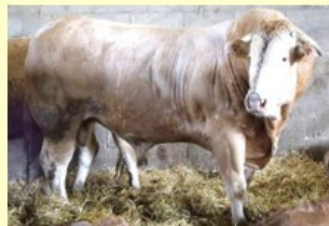
Bearnais (V. van Irea) DM76 DS90 QR82 AF72 NG80