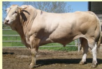
Rubio (V.van Zandv.Julian) DM83 DS90 QR96 AF85 NG88

Naam : Katrjin Lev.nr. : NL 6418 9556 6 Geb.dat: Exterieur Fokker: Lft SH O Rt Bs B AV 4.2 145 84 86 85 84 85