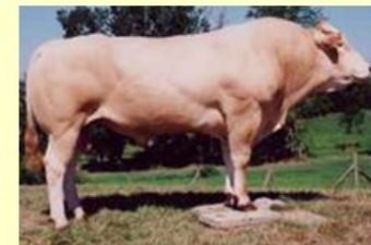
Richelieu (V. van Desi) DM-- DS-- QR-- AF-- NG--