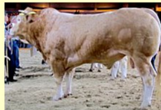
Domy (V. van Fromant) DM84 DS70 QR86 AF75 NG78