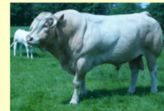
Neuville (V. van Esra) 12.2 sh.164 O89 RT92 BS91 B88 AV90