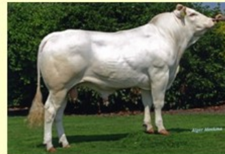
Valex (V. van Katrjin) 3.2 147 O81 RT84 BS84 B86 AV84