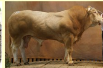
Flamenco (V. van Imperial) DM73 DS91 QR90 AF78 NG83