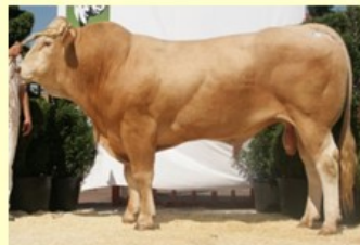
Acadien (V. van Femmy vd Bosch) 3.11 sh. 169 O89 RT88 BS84 B85 AV87