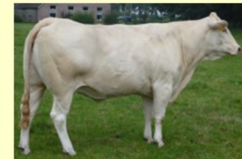
Allet ( M.van Judith) pref.stamm. 6.0 sh.161 O91 RT89 BS89 B87 AV89