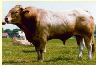
Ecu (V. van Nemo R) 2.7 sh.159 O90 Rt89 Bs89 B88 AV89

Lft SH O Rt Bs B AV 2.11 144 84 84 86 84 84