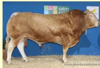
Ete (V. van Horfe) DM83 DS73 QR76 AF82 NG78