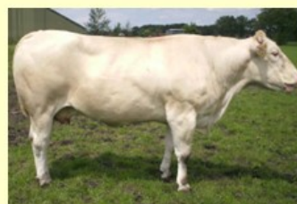
Bakersf.Marjan (M. van Bernice) 7.2 sh. 150 O87 RT86 BS85 B88 AV87